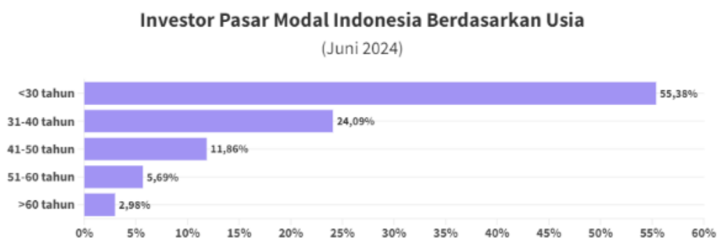
Tabel 1. Investor Pasar Modal Berdasarkan Usia

Dalam penelitian ini, penulis memfokuskan pada minat investasi di kalangan mahasiswa FEB, khususnya Prodi Akuntansi dan Manajemen di UMUS. Hal ini didasarkan pada statistik pasar modal Indonesia yang menunjukkan bahwa investor muda, khususnya yang berusia 30 tahun ke bawah, mendominasi dengan presentase mencapai 58,78%. Setelah kelompok ini, terdapat investor berusia 31-40 tahun sebanyak 22,38%, diikuti oleh mereka yang berusia 41-50 tahun dengan presentase 10,82% (Ortega & Paramita, 2028). Data ini menyoroti pentingnya perhatian terhadap generasi muda, terutama mahasiswa, yang berpotensi menjadi bagian dari pertumbuhan investor di pasar modal. Dengan memahami minat dan faktor-faktor yang mempengaruhi mereka, diharapkan dapat meningkatkan partisipasi mahasiswa dalam investasi.