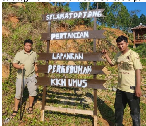
Gambar 2. Hasil Papan Informasi

Papan informasi visual di Desa Badak berfungsi sebagai media komunikasi publik yang mampu menyajikan informasi secara jelas dan terstruktur. Efektivitas papan sejalan dengan gagasan Ambara dkk. (2024) yang mengembangkan website desa wisata sebagai media informasi. Papan memiliki fungsi utama yang sama, yaitu menyampaikan identitas desa dan memperkuat pemahaman masyarakat walaupun berbentuk non-digital. Papan informasi berperan penting dalam membangun identitas visual desa. Branding desa melalui media visual terbukti meningkatkan pemahaman masyarakat terhadap potensi lokal serta memperkuat citra desa [4]. Papan tidak sekadar penanda lokasi, tetapi juga bagian dari strategi komunikasi visual berbasis pangan dan kemandirian lokal.