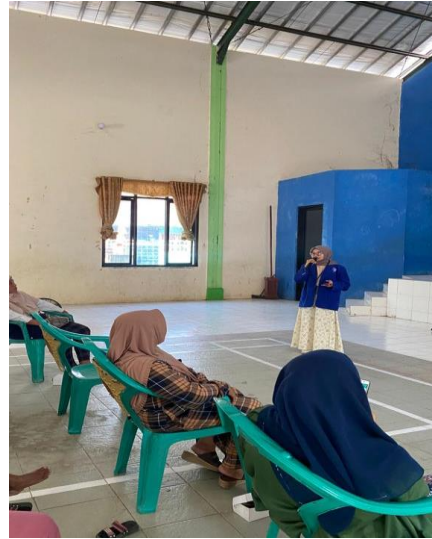
Gambar 2. Praktik Pembukuan Keuangan Sederhana

Materi berikutnya yaitu praktek membuat pembukuan keuangan sederhana dengan jurnal umum. Dengan menyelesaikan contoh soal transaksi lalu dibuatkan pencatatan jurnal umumnya. Hal tersebut dilakukan supaya Ibu-ibu PKK paham bagaimana cara membuat pembukuan keuangan sederhana dengan jurnal umum.