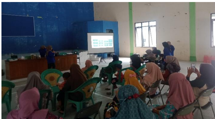
Gambar 1. Sosialisasi Literasi Keuangan

Kegiatan diawali dengan pemaparan materi mengenai literasi keuangan tujuannya agar iu-ibu PKK mnedapatkan gambaran umum, tujuan, dan manfaat literasi keuangan. Gejala maraknya penipuan investasi dan praktekpinjaman yang melawan hukum di masyarakat menekankan pentingnya literasi keuangan. Dengan pemahaman tentang investasi yang benar dan praktek pinjaman yang sah, masyarakat dapat menghindari risiko menjadi korban penipuan keuangan. Literasi keuangan memberikan alat bagi individu untuk secara kritis mengevaluasi tawaran investasi yang terlalu menggiurkan dan memahami syarat-syarat pinjaman dengan cermat.