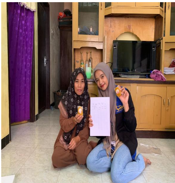
Gambar 1. Memberikan pelatihan pembukuan secara door to door ke tempat UMKM Bika Ambon di Desa Tenjomaya.

Proses pelaksanaan Pelaksanaan pengabdian kepada masyarakat sebagai berikut: