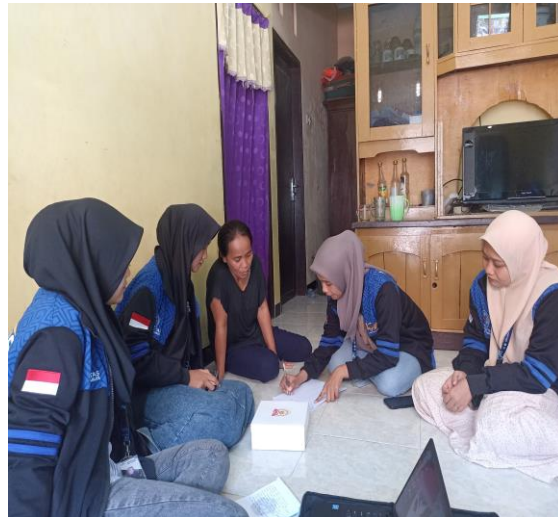
Gambar 3. Memberikan Pelatihan Pembukuan

Kegiatan dilaksanakan secara door to door ke tempat UMKM di Desa Tenjomaya sekaligus pendampingan pada pelaku UMKM sebagai implementasi dari program pengabdian pada masyarakat yang telah dilakukan.