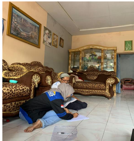
Gambar 2. Memberikan pelatihan dan penyuluhan pembukuan secara door to door ke tempat UMKM Tempe di Desa Tenjomaya