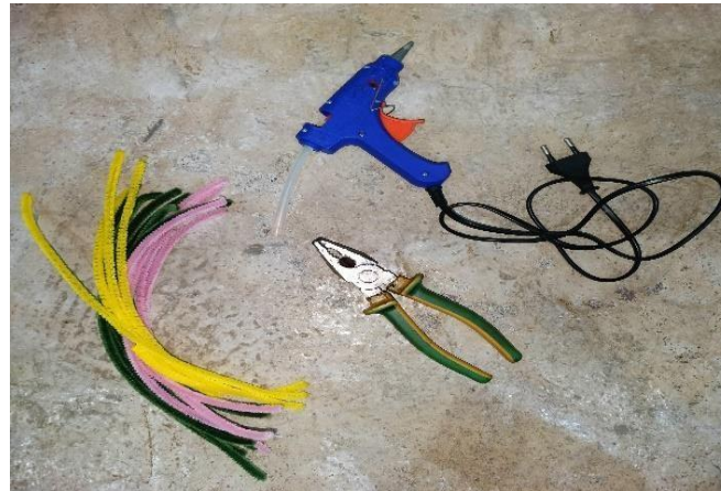
Gambar 1. Alat dan Bahan