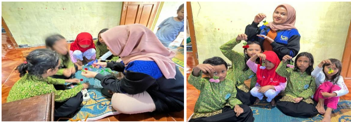
Gambar 3. Proses Pembuatan dan Hasil Gantungan Kunci

Secara keseluruhan, kegiatan ini memberikan pengalaman langsung bagi anak-anak dalam mengembangkan keterampilan motorik serta memperkenalkan mereka pada konsep kewirausahaan. Dengan adanya metode yang interaktif dan dukungan berbagai media pembelajaran, anak-anak semakin antusias untuk belajar dan mencoba hal-hal baru yang lebih produktif dibandingkan hanya bermain game online.