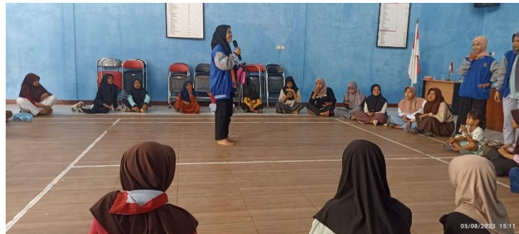
Gambar 2. Penyampain Materi