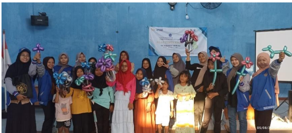
Gambar 5. Peserta Kegiatan Pengabdian Pelatihan Buket Balon

Untuk membangkitkan minat remaja Desa Tiwulandu terhadap program "Buket Balon: Pelatihan Kewirausahaan Handycraft untuk Menggali Kreativitas", pendekatan yang holistik dan berorientasi pada partisipasi aktif menjadi kunci utama. Melalui serangkaian kegiatan yang menarik dan relevan dengan minat serta kebutuhan mereka, program ini bertujuan untuk menginspirasi dan melibatkan remaja dalam proses pembelajaran dan pengembangan keterampilan kewirausahaan. Dalam upaya ini, penyelenggara program akan berfokus pada identifikasi minat dan potensi kreatif remaja melalui survei, wawancara, dan observasi langsung di lingkungan Desa Tiwulandu. Dengan memahami minat dan aspirasi mereka, program "Buket Balon" akan merancang kegiatan-kegiatan yang menarik dan bermanfaat, seperti lokakarya interaktif, demonstrasi pembuatan produk handycraft, dan kegiatan kompetisi kreatif.