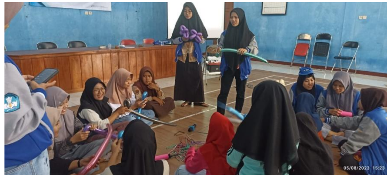
Gambar 4. Pembuatan Kelopak Bunga

Pembuatan buket kelopak bunga balon satu persatu dan membuat tangkai balon serta pita balon. Pada umumnya para peserta merasa puas karena itu adalah hasil karya buket bunga pertama kalinya. Peserta pun meyakini bahwa pembuatan buket bunga tersebut akan mampu membantu dalam memahami kreativitas yang ada pada diri peserta didik sehingga mereka mampu mengembangkan kreativitas tersebut dalam bidang usaha. Hasil karya peserta pun nantinya dapat dijadikan sebagai salah satu produk yang bisa diperjual belikan di masyarakat. Kegiatan tersebut akhirnya dapat membantu masyarakat dalam mengurangi angka pengangguran dengan menciptakan sebuah lapangan pekerjaan di bidang pelayanan produk yang memiliki kualitas bernilai jual tinggi.