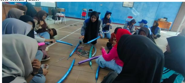
Gambar 3. Praktik Pelatihan

Dalam pembuatan buket balon ini para remaja didampingi oleh mahasiswa UMUS. Tujuan para remaja didampingi oleh mahasiswa dalam pembuatan buket balon ini agar dapat dibantu jika mereka mengalami kesulitan dan kesusahan di dalam proses pelatihan pembuatan. Dalam kegiatan ini para remaja di bebaskan untuk berkreasi, memilih warna balon untuk menata dan mendesain balon yang telah disiapkan sesuai dengan kreativitas dan keinginan mereka. Hal ini untuk meningkatkan kemampuan dan kekreativitasan para remaja dalam membuat sebuah produk yang memiliki nilai jual.