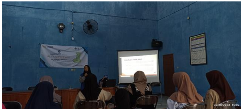
Gambar 1. Pembukaan Pelatihan

Pelaksanaan pembukaan kegiatan ini diawali dengan registrasi peserta. Sebelum dilakukan tahapan pelatihan, dimulai dengan acara pembukaan kegiatan yang dihadiri para remaja Desa Tiwulandu dan mahasiswa Universitas Muhadi Setiabudi (UMUS). Kegiatan ini dilakukan untuk meningkatkan kreativitas dan memberikan inovasi untuk membuat suatu produk yang memiliki nilai jual. Hasil dari produk ini dapat menjadikan para remaja yang bisa berwirausaha dan berbisnis untuk menghasilkan pendapatan di usia yang masih terbilang muda. Dengan menjadikan remaja sebagai seorang yang bisa menjalankan bisnis.