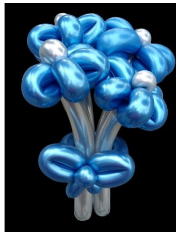
Gambar 5. Hasil Pelatihan Buket Balon

Kegiatan penguatan materi meningkatkan konsentrasi para remaja akan pelatihan atau pelajaran yang sedang dilaksanakan, meningkatkan motivasi belajar para remaja agar terus semangat dalam berkarya dari bahan-bahan yang ada di sekitar untuk menjadi sebuah prodak yang bernilai jual tinggi dan dapat menjadi ide bisnis. Para peserta mempunyai minat yang tinggi untuk berpartisipasi dalam kegiatan pelatihan pengembangan keterampilan dan kreativitas.