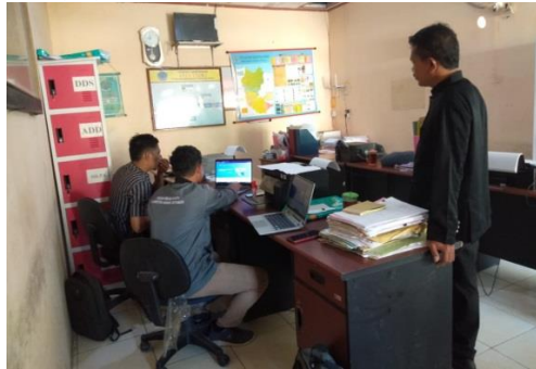
Gambar 2. Pelatihan dan Pengoperasian Website Bersama Operator Desa Ciawi.

penanggung jawab dan sekretaris desa sebagai ketua pelaksana website desa, seluruh kepada dusun (dukuh) atau yang mewakilinya, pamong desa dan operator web yang ditugaskan secara khusus untuk menangani website desa. Pelatihan dilakukan selama satu hari penuh yaitu mulai jam 08.00 sampai dengan jam 16.00 WIB, bertempat di balai desa Ciawi. Kegiatan pelatihan dapat dilihat seperti pada Gambar 2, 3, 4.