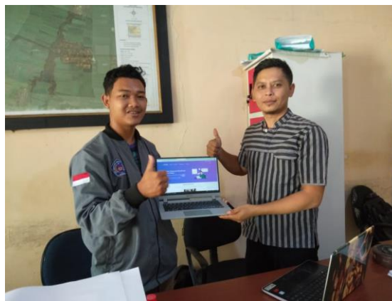
Gambar 4. Penyerahan Akun Website kepada Operator Desa Ciawi