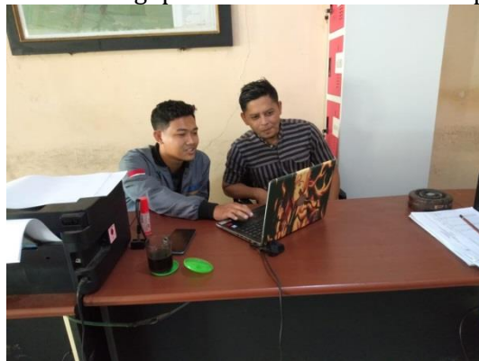
Gambar 3. Pelatihan dan Pengoperasian Website Bersama Operator Desa Ciawi.