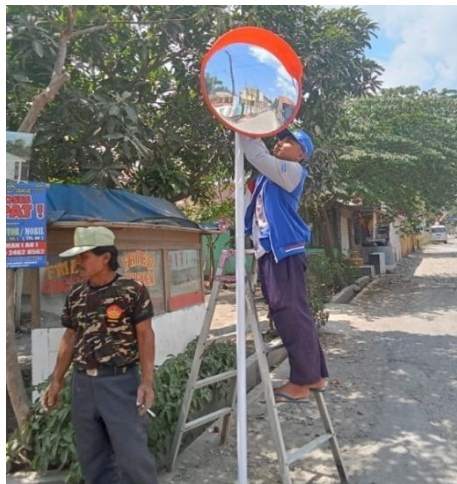
Gambar 3. Proses pemasangan cermin cembung

Pada tahap inilah dilakukan pembelian alat dan bahan yang dibutuhkan untuk memasang cermin cembung. Perencanaan waktu kegiatan juga dilakukan pada tahap ini. Tahap persiapan ini harus dilakukan dengan matang, karena akan berpengaruh terhadap pemasangan. Pemasangan cermin cembung disaksikan oleh pemerintah desa dan dibantu oleh masyarakat. Pemasangan cermin cembung berlangsung dengan lancar dan baik walaupun saat membuat lubang pada tanah untuk menancapkan tiang cermin agak mengalami kendala yaitu tanah yang berbatu, tetapi semua itu bisa diatasi dengan baik. Hasil dari pemasangan ini yaitu cermin cembung yang terpasang dengan baik dan ideal tanpa mengganggu pengemudi saat berkendara. Implementasi kegiatan Manfaat cermin cembung ini dapat langsung dirasakan oleh masyarakat yang berkendara. Dengan adanya cermin cembung ini diharapkan dapat mengurangi resiko kecelakaan yang sering terjadi di lokasi tersebut. Masyarakat juga menyadari dan paham akan pentingnya keselamatan dalam berkendara.