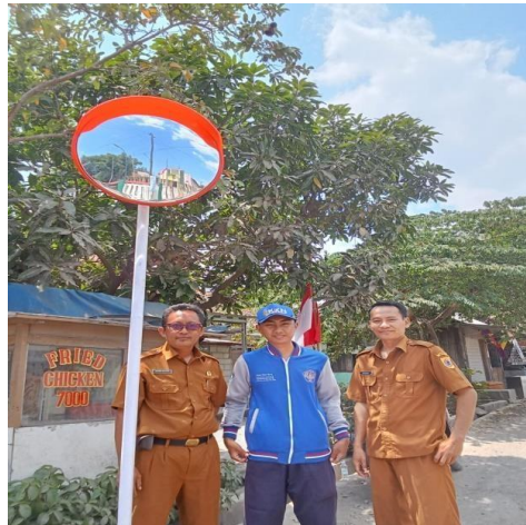
Gambar 3. Setelah pemasangan cermin cembung

Pemasangan cermin cembung di desa dapat memberikan sejumlah manfaat signifikan bagi warganya. Pertama, cermin cembung dapat digunakan untuk meningkatkan keamanan di lingkungan desa dengan memberikan visibilitas yang lebih baik, terutama di tikungan atau persimpangan jalan yang sulit terlihat. Hal ini dapat mengurangi risiko kecelakaan lalu lintas dan memberikan rasa aman bagi pengguna jalan, terutama pada malam hari. Selain itu, pemasangan cermin cembung dapat membantu dalam pengawasan dan keamanan rumah. Dengan memasang cermin di titik-titik strategis, warga desa dapat memiliki visibilitas tambahan terhadap aktivitas di sekitar rumah mereka, membantu mencegah tindakan kriminal dan memberikan tingkat keamanan yang lebih tinggi.