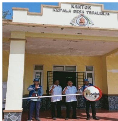
Gambar 1. Tim Pengabdian

Metode persiapan pelaksanaan kegiatan diawali dengan menanyakan masalah yang berkaitan dengan ilmu ketekniksipilan kepada perangkat desa dan masyarakat sekitar. Lalu ditemukanlah masalah yang berhubungan dengan ilmu ketekniksipilan yaitu rekayasa lalu lintas. Agar kegiatan berjalan dengan lancar dan mendapat dukungan dari masyarakat setempat dan pemerintah desa maka dilakukanlah komunikasi yang intensif. Setelah mendapat persetujuan dari pemerintah desa. Tahap selanjutnya mulailah membeli alat dan bahan. Setelah melakukan pembelian, dilakukan perakitan dan pemasangan. Pelaksanaan kegiatan ini berlokasi di Desa Tegalreja, Kecamatan, Banjarharjo Kabupaten Brebes melibatkan beberapa orang yang terdiri dari pemerintah desa dan perwakilan masyarakat.