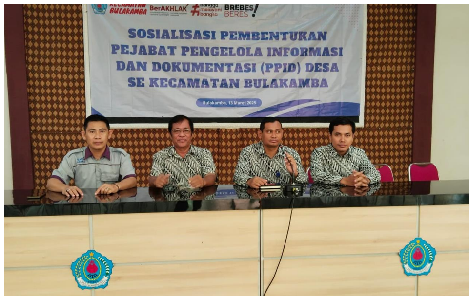
Gambar 1. Kegiatan Pendampingan Penguatan Kapasitas Perangkat Desa

lah sosial keagamaan. Kurikulum ini akan disesuaikan dengan tingkat pemahaman peserta, sehingga dapat dipahami oleh perangkat desa dengan latar belakang pendidikan yang beragam.