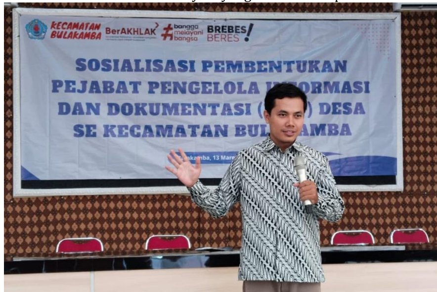
Gambar 2. Pemberian Pendampingan pada Perangkat Desa

Setiap peserta diberi kesempatan untuk mengajukan pertanyaan terkait materi pelatihan dan masalah yang mereka temui dalam tugas sehari-hari. Fasilitator akan memberikan klarifikasi dan solusi praktis berdasarkan hukum Islam. Pelatihan dilakukan dengan pendekatan partisipatif yang mendorong diskusi dan interaksi antara fasilitator dan peserta. Metode ini bertujuan agar peserta tidak hanya memahami teori, tetapi juga bisa langsung mengaplikasikan pengetahuan tersebut dalam situasi nyata yang mereka hadapi di desa.