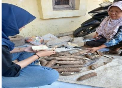
Gambar 4. Proses Pengupasan dan Pemotongan Singkong