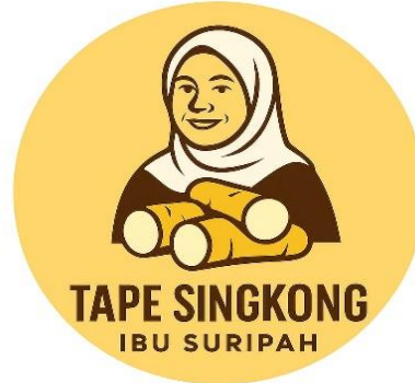
Gambar 3. Label Merk

Label berperan sebagai identitas atau tanda khas suatu produk [11]. Kehadiran label diharapkan dapat membantu konsumen dalam membedakan produk satu dengan produk lainnya. Pembuatan label pada produk sangat dianjurkan sebagai salah satu strategi untuk meningkatkan penjualan [12]. Selain dapat menarik minat konsumen untuk membeli, label juga berfungsi sebagai alat untuk mencegah kesalahan dalam proses pembelian [13].