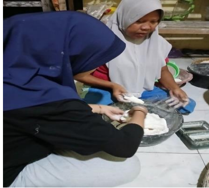
Gambar 7. Proses Peragian dan Pengemasan Produk

e. Kelima, melakukan pendampingan pemasangan label pada kemasan produk