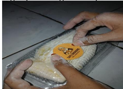
Gambar 8. Pemasangan Label pada Kemasan Produk

e. Kelima, melakukan pendampingan pemasangan label pada kemasan produk