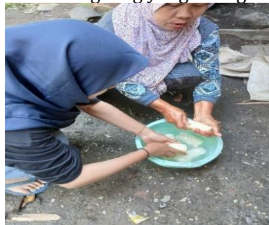
Gambar 5. Proses Pencucian Tape