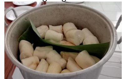
Gambar 6. Proses Perebusan Tape Singkong